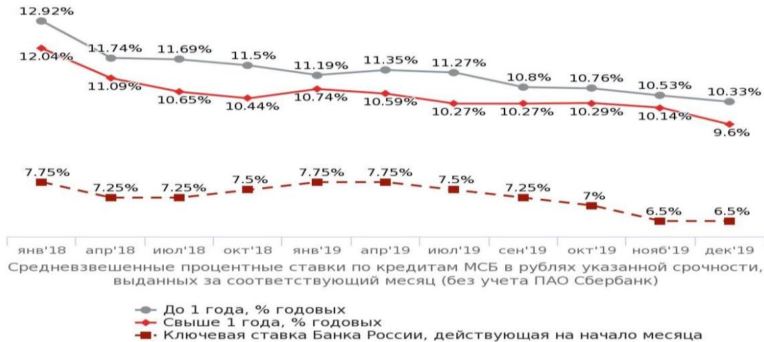
Рис. 3. Ставки кредитования МСБ (Официальный сайт Центрального банка России)

Существенное увеличение показателя кредитования предприятий малого и среднего бизнеса достигается также при влиянии нескольких факторов. В первую очередь, этому способствовала тенденция к снижению на рынке процентной ставки и ключевой ставки ЦБ РФ (Рисунок 3):