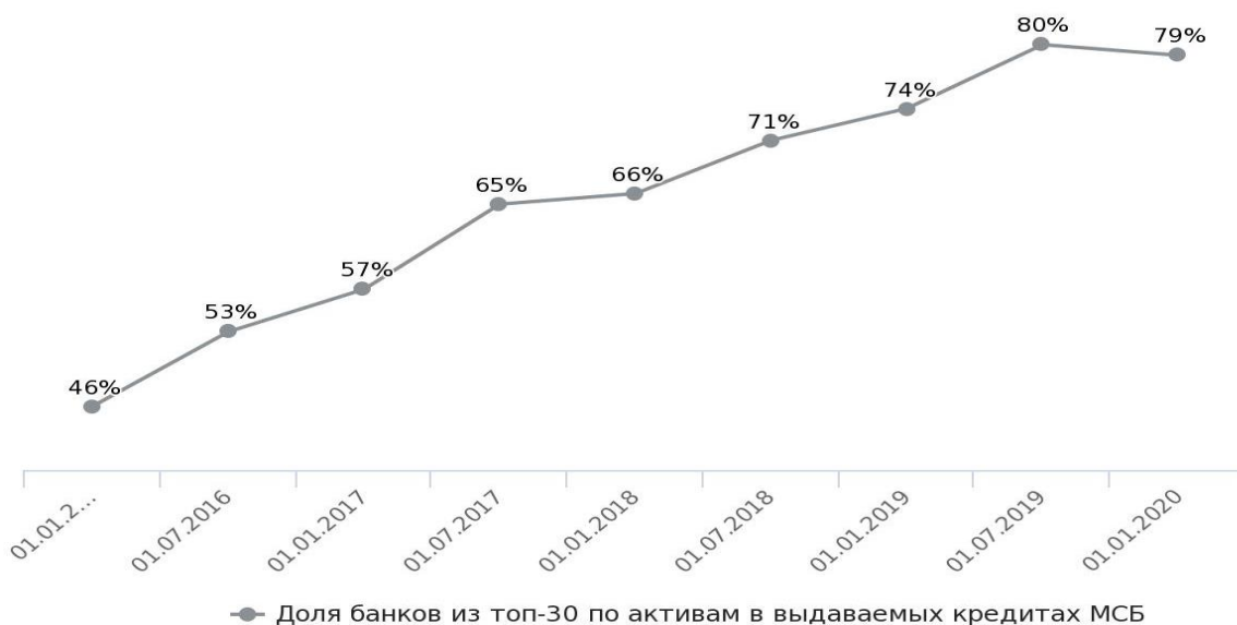
Рис. 4. Доля банков из топ-30 по активам в выдаваемых кредитах МСБ (Официальный сайт Центрального банка России)

Рыночным механизмом рефинансирования кредитных портфелей предприятий малого и среднего бизнеса за период 2018–2019 годов выступили сделки секьюритизации. За указанный период было проведено 4 выпуска облигаций, который обеспечивался поступлениями от кредитования малого и среднего бизнеса. Их общая сумма составила 22 млрд. руб.