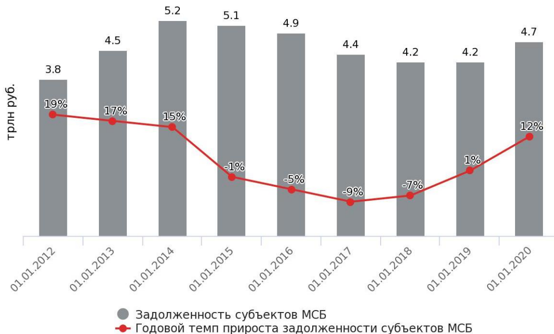
Рис. 2. Задолженность субъектов МСБ в 2011-2019 гг., трлн руб. (Официальный сайт Центрального банка России)

При этом в 2019 году также отмечается и высокий показатель задолженности по уплате кредитных обязательств предприятиями малого и среднего бизнеса, который составил 4,7 трлн. руб., тем самым в первый раз, с 2014 года, продемонстрирована его положительная тенденция – за 2019 год прибавка в 12 % (Рисунок 2):