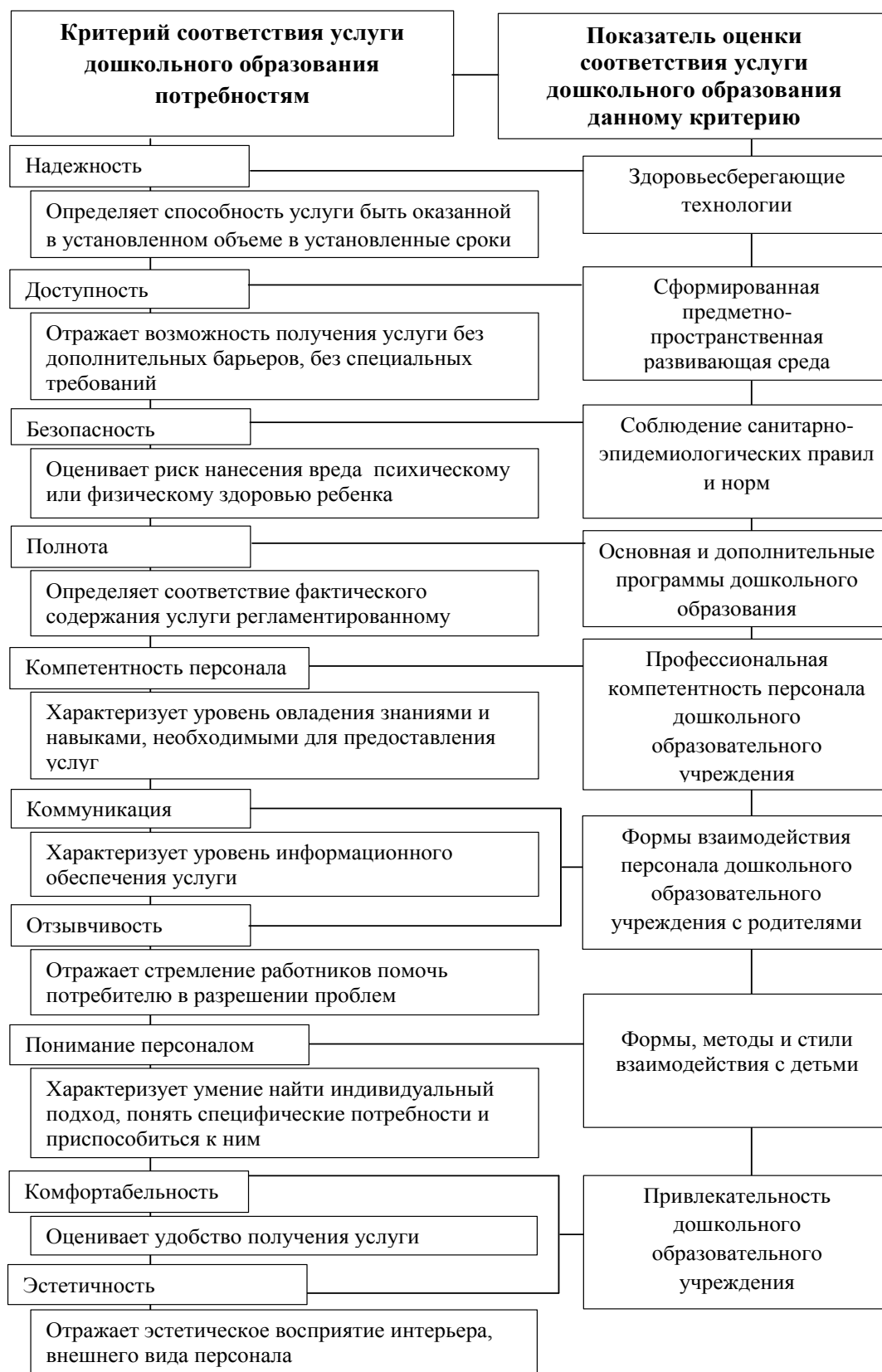
Рис. 1. Свойства услуги дошкольного образования

Деятельность дошкольного образовательного учреждения подчинена ряду факторов, которые определяют его потенциал в обеспечении потребительской полезности оказываемых услуг. Возможность реализации данного потенциала обуславливается условиями, в которых представленные факторы действуют (рис. 2).