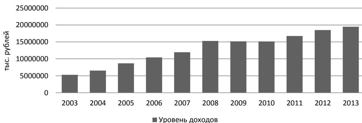
Рис. 2. Доходы санаторно-курортных организаций Приволжского федерального округа (составлено по данным [7])

Согласно приведенным данным в округе наблюдается рост доходов в санаторно-курортных организациях. С 2003 года по 2008 год их увеличение произошло в 2 раза, что говорит о перспективности развития данного направления, стабилизацией экономического развития округа, увеличением доходов населения, ростом цен на санаторно-курортные путевки. С 2009-2010 гг. роста и уменьшения доходов не происходит, что связано с процессами попытки стабилизировать экономическое развитие округа. При этом, население пока не может позволить отдых и лечение, поскольку доходы не так стабильны, как в период до кризиса. С 2010-2013 гг. наблюдается значительный рост денежных поступлений от санаторно-курортной деятельности на 22,1 %, что можно объяснить увеличением стоимости путевки (дороговизна добычи лечебного сырья, затратная транспортная доставка), ростом спроса на лечение и оздоровление.