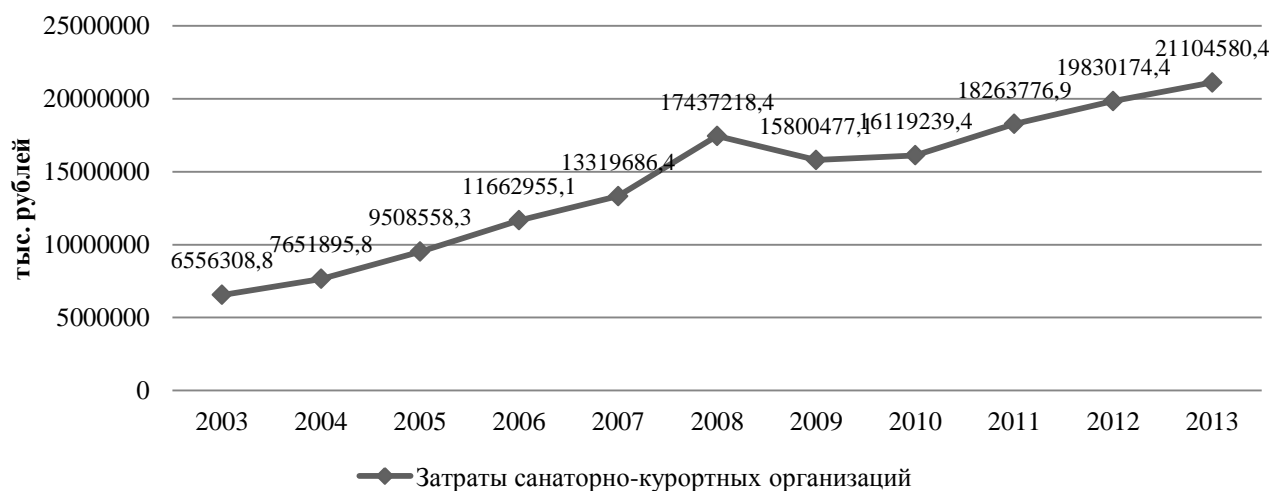
Рис. 3. Затраты санаторно-курортных предприятий Приволжского федерального округа (составлено по данным [7])

Уровень затрат напрямую зависит от уровня доходов и не может рассматриваться как отдельный фактор, поскольку между ними существует прямая зависимость. Отразим затраты санаторно-курортных предприятий на рис. 3.