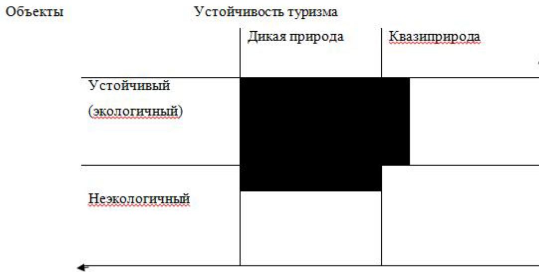
Рис. 2. Емкость понятия «сельский туризм» (залитая площадь – поле сельского туризма)

от деградации природной среды чаще всего наступает не так скоро, обычно уже по истечении срока окупаемости проектов.