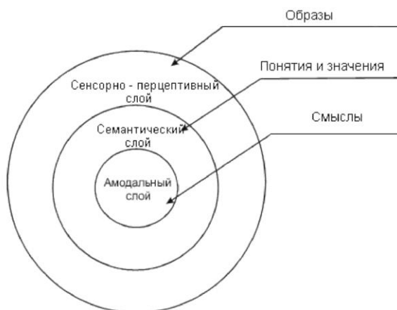
Рис. 1. Уровневое строение образа мира [2]

В то же время образ мира сам является уровневым образованием, имеет иерархическую структуру, в рамках которой упорядочиваются его содержания – образные явления, значения и смыслы.