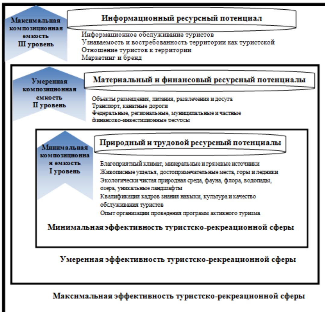
Рис. 1. Структура ресурсного потенциала сферы рекреации и туризма с позиции композиционного подхода

Авторская логика построения уровней представляется следующим образом (рисунок 1): 1 уровень – соединение природного и трудового потенциалов (соединение этих двух элементов системы не обеспечивает эффективность сферы деятельности и экономики в целом и характеризуется минимальной эффективностью и минимальной композиционной емкостью);