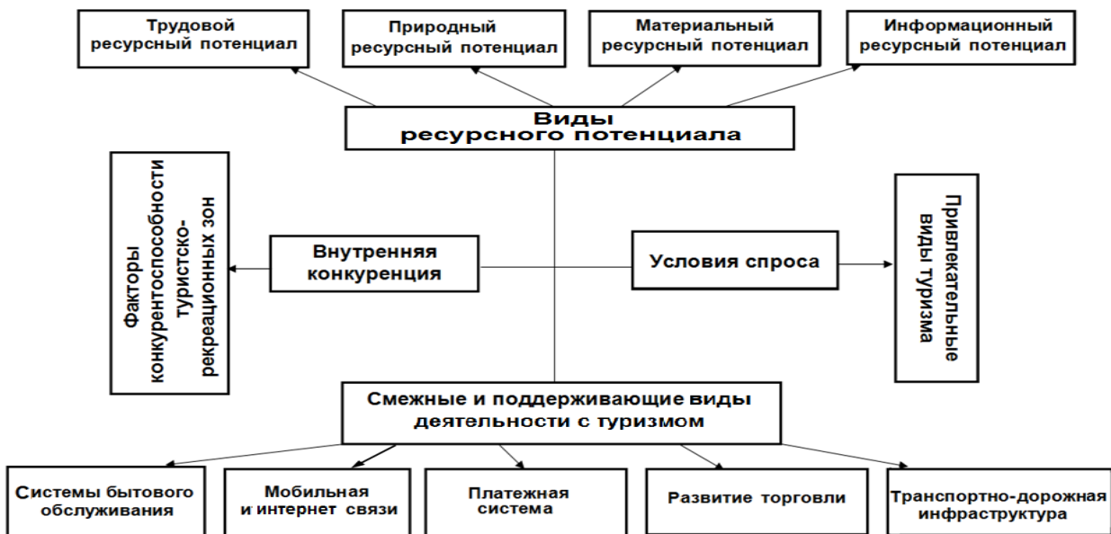
Рис. 2. Концептуальный подход к формированию системы детерминантов ресурсного потенциала сферы рекреации и туризма

Анализ методов и подходов, используемых при исследовании ресурсного потенциала сферы рекреации и туризма, для оценки ресурсного потенциала сферы рекреации и туризма КБР позволил принять за основу модель «конкурентного ромба» М. Портера. На ее основе разработана модель системы детерминантов ресурсного потенциала сферы рекреации и туризма посредством группировки факторов, оцениваемых с позиции возможности удовлетворения разнообразных потребностей туристов (рисунок 2).