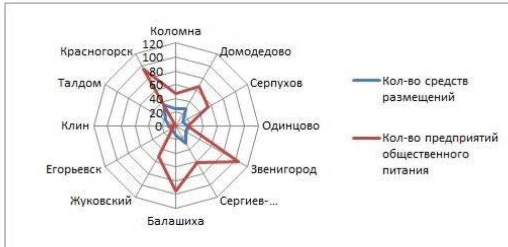
Рис. 1. Сравнение средств размещения и предприятий общественного питания в туристских кластерах Московской области

Для формирования туристского потока и организации туристской деятельности территориальных образований Московской области необходимы не только туристские ресурсы и их привлекательность, но и туристская инфраструктура. Была изучена инфраструктура гостинично-ресторанного бизнеса Московской области, результаты анализа, которые представлены на рисунке 1 [9, 10].