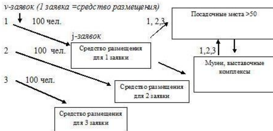
Рис. 2. Формирование туристских потоков по маршруту «Бронзовое кольцо Московской области»

Таким образом, размещение туристов по маршруту «Бронзовое кольцо Московской области» происходит на базе трех средств размещения, максимальные возможности средств размещений составляют 900 человек. Был предложен процесс обслуживания 300 человек, что составляет 31 % от общих возможностей работы средств размещения.