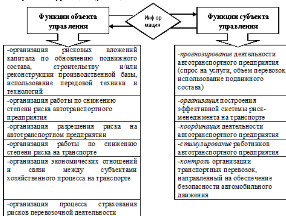
Рис. 2. Основные функции риск-менеджмента на транспорте

Риск-менеджмент находит свое внешнее и внутреннее проявление в функциях. Исходя из характера подсистем, нам представляется, возможным выделить для автотранспортного предприятия следующие функции (рис. 2).