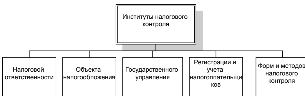
Рис. 2. Институты налогового контроля

Для налогового контроля создаются свои институты. На рис. 2. представлена схема основных институтов налогового контроля.